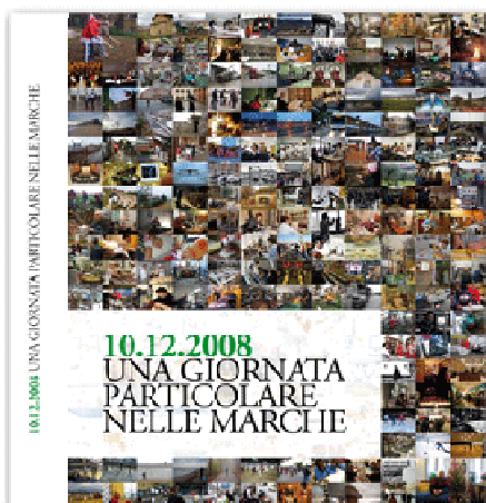
Copertina libro FIAF

La mia foto "AMBULANZA CRI IN USCITA PER UN'EMERGENZA", selezionata dal coordinamento artistico del progetto, è stata pubblicata a pagina 107 nel capitolo "i ritmi del quotidiano".